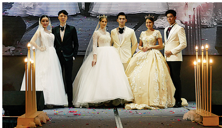
2018 檳榔树酒店婚礼展销会，由 Aspial Wedding 呈献的婚纱秀，耀眼华丽，惊艳全场。