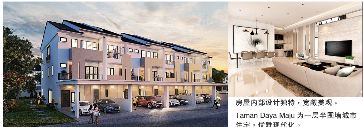
房屋内部设计独特，宽敞美观。Taman Daya Maju 为一层半围墙城市住宅，优雅现代化。