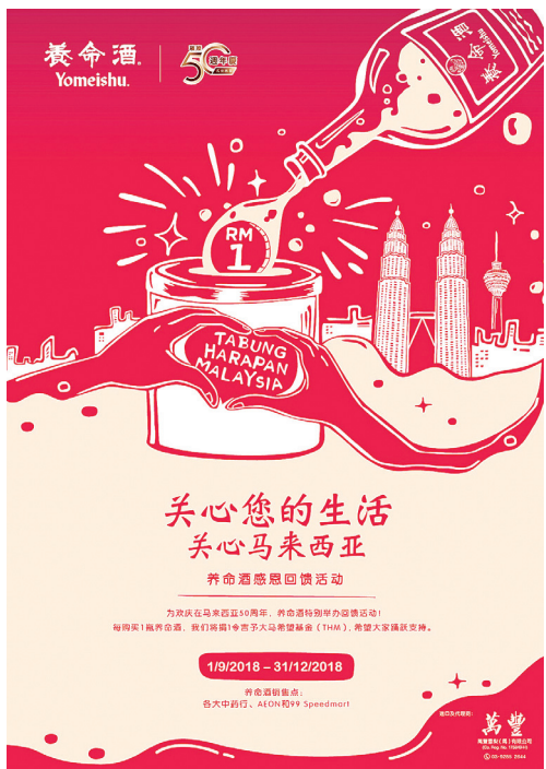
养命酒欢庆在马来西亚 50 周年庆，以更具意义的方式回馈马来西亚支持者。

欲知更多详情，请联系大马养命酒总代理——万丰雪梨 (马) 有限公司 03-9285 2644