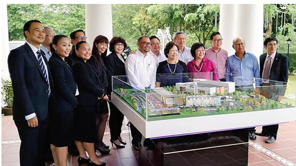
MTT 产业与发展有限公司出席职员在 Botanica CT 市镇展示模型前合影。