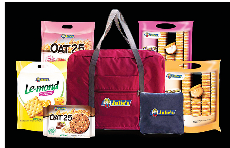
Julie's 为了回馈予长期对该品牌支持的忠实消费者，特别限量推出两个颜色的精美可折叠旅行袋供顾客们换取。

www.facebook.com/JuliesBiscuits/ www.julies.com.my